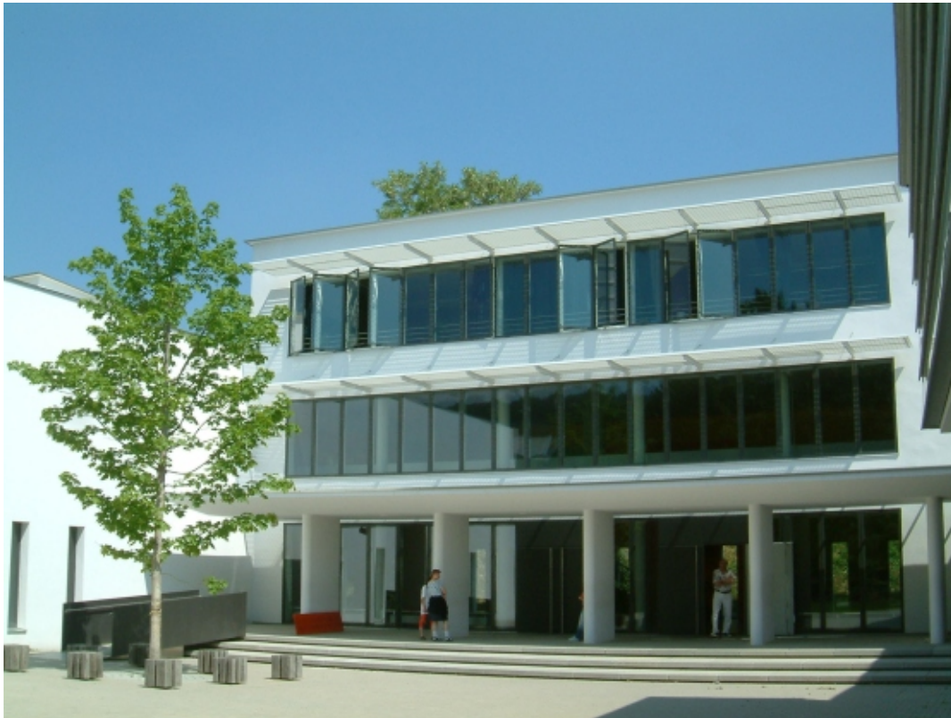
Sonnenschutz aus Gitterrost Aluminium